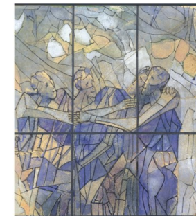
AMAI-VOS UNS AOS OUTROS JO 15,12

Na segunda semana da nossa caminhada da Quaresma, o apelo «escutai-O», na cena da transfiguração, convida-nos à escuta da PALAVRA, a voltar ao essencial. Na verdade “a Sagrada Escritura é fonte de alegria” (EG 5)! “O anúncio da Palavra cria comunhão e gera a alegria. Anunciando a Palavra de Deus, queremos comunicar também a fonte da verdadeira alegria, que brota da certeza de que só Jesus tem palavras de vida eterna” ( Verbum Domini , 123). Pe. Feliciano Garcês, scj